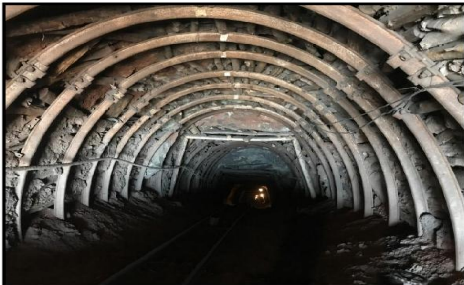
تصویر (۱): صوف معدنی نمبر (۳) از معدن زغال سنگ کرکر پلخمری، ولایت بغلان.

تحقیق ساحوی: معادن زغال سنگ کرکر به فاصله (۱۵) کیلومتر به طرف شمال شرق شهر پلخمری موقعیت دارد بالاثرفحریات و کارهای اکتشافی که در ساحه معدنی کرکر انجام شده است سه طبقه زغال سنگ به ضخامت های (۲-۳) متر عریان سازی شده است. زغال سنگ کرکر از لحاظ عمر به دوره جیولوجیکی جوراسیک وسطی- تحتانی تعلق می گیرد. رنگ زغال سنگ از نضواری مایل به سیاه می باشد. نوعیت زغال سنگ بیتومینوس بوده که دارای قدرت حرارت دهی (۵۸۵۲-۶۰۷۳) کیلوکالوری بوده و خاکستردهی آن تا به ۲۸ فیصد می رسد. قابل ذکر است که عملیات اکتشافی محدود بوده و تمام ساحه معدنی کرکر به صورت همه جانبه و جامع مورد مطالعه جیولوجیکی قرار نگرفته است. در تصویر (۱) صوف معدنی ساحه مذکور نشان داده شده است (عرفان، ۱۴۰۲).